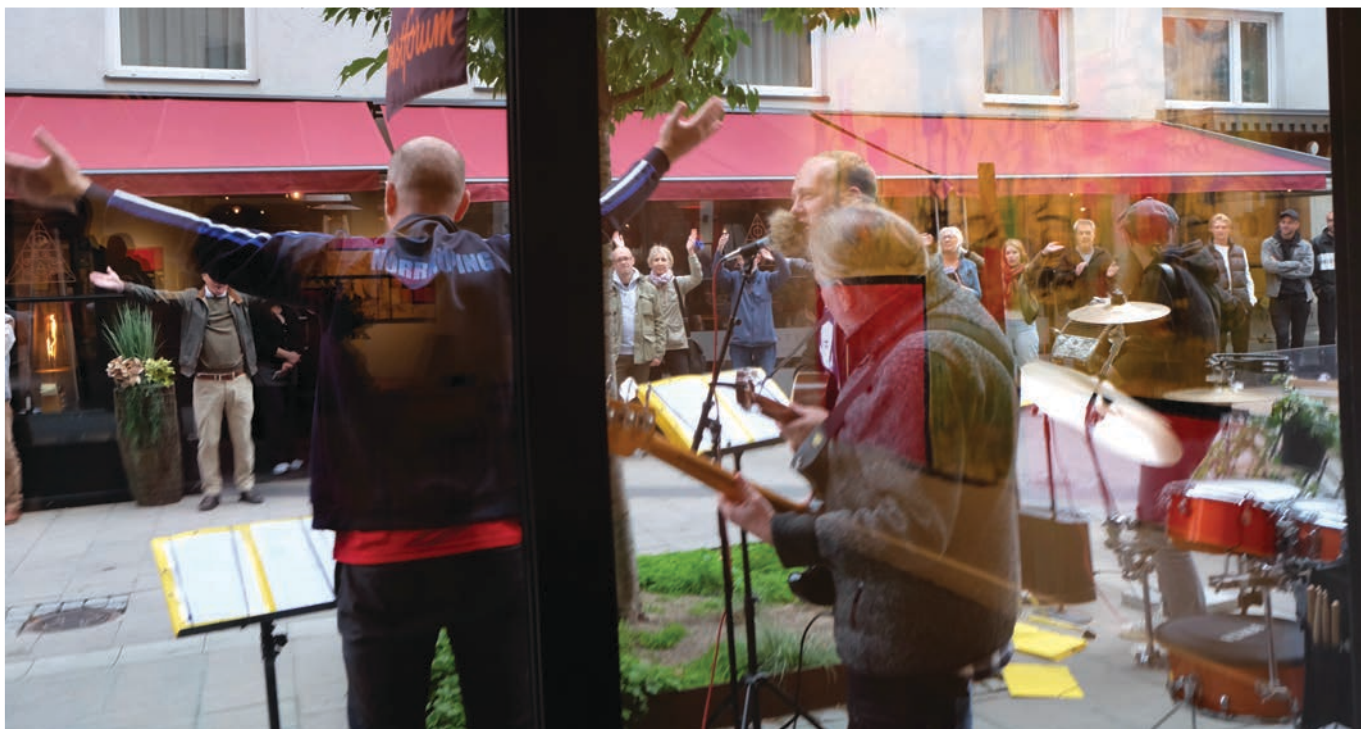
Folkfest. Vernissagepubliken radade upp sig utanför Konstforum när Guldstruppen besjög "Snoka". Klackledarlegendaren Posse förstärkte Guldstruppen i "Klackledarens sång".