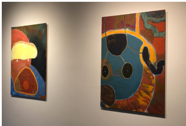
Skilj. Lur. Akryl på duk, samt oljekrita.