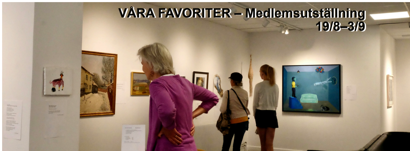
Favoritkonsten förklaras i några korta meningar på ett pappersark vid varje verk.