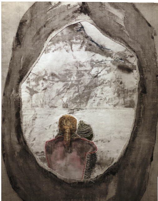
Porträtt/Inblick. Måleri & broderi.

Barndomens somrar slår igenom i de nästan arkaiska bilderna: vulkankullar, låga hus, gestalter – och hårflätor.