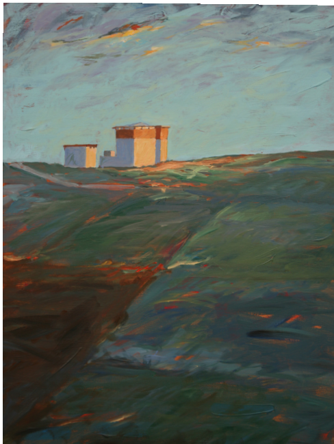
Periferi. Akryl på duk.